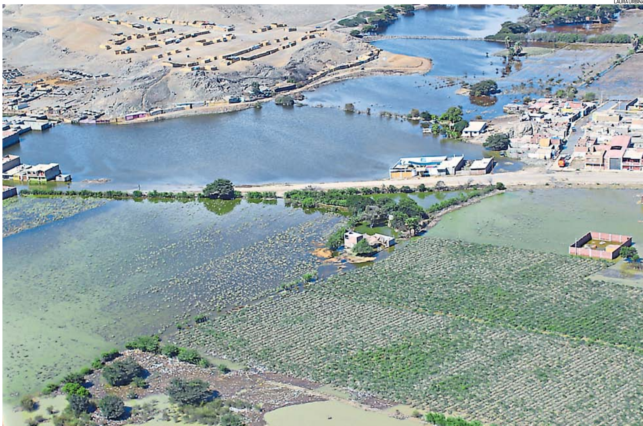
Esta imagen pertenece a Huarney (Ancash), donde se puede ver al mismo tiempo los daños causados en la infraestructura vial, en las zonas agrícolas y en las viviendas.