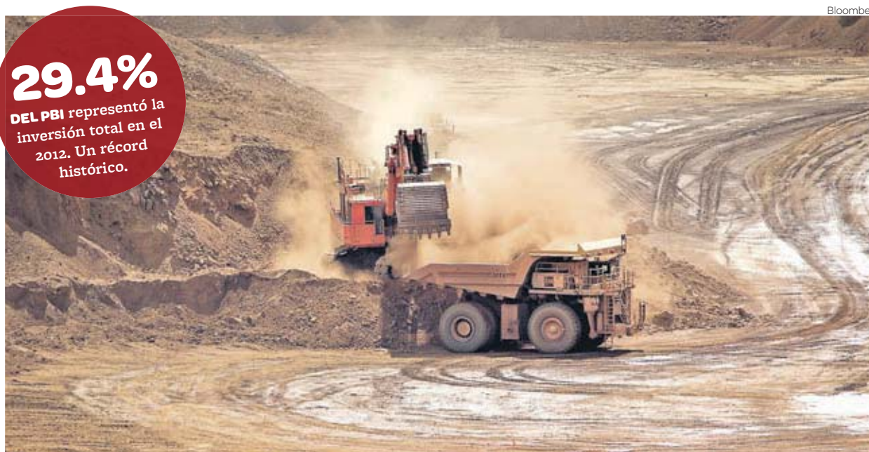
Se han cancelado US$2,000 millones de inversiones mineras anunciadas para este año, estimó Daniel Córdova, en un foro de ComexPerú.

La tasa esperada para el primer trimestre del 2013 supone una fuerte desaceleración comparada con las obtenidas en los últimos trimestres del 2012. En el tercer