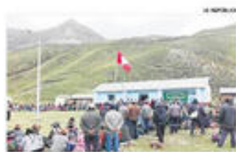
Ronderos siguen trabajando en distrito de Yanatile.