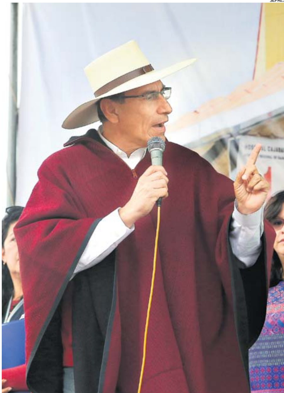
El presidente Martín Vizcarra cumplió ayer actividades en la región Cajamarca.