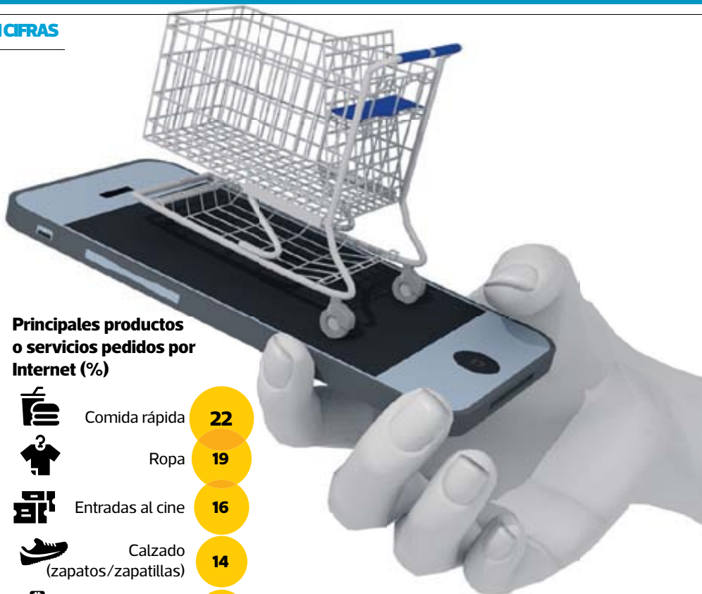
Principales productos o servicios pedidos por Internet (%)