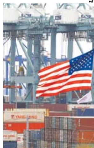
El PBI había crecido 2,2% en el último trimestre del 2018.

El PBI de Estados Unidos creció a una tasa anualizada de 3,1% en el primer trimestre del año. Este crecimiento estuvo en línea con las expectativas de los analistas; sin embargo, el índice de inflación subió a 1% en el último trimestre, en lugar del 1,3% reportado antes. La economía cumplirá 10 años de expansión en julio, el período más largo de crecimiento ininterrumpido.