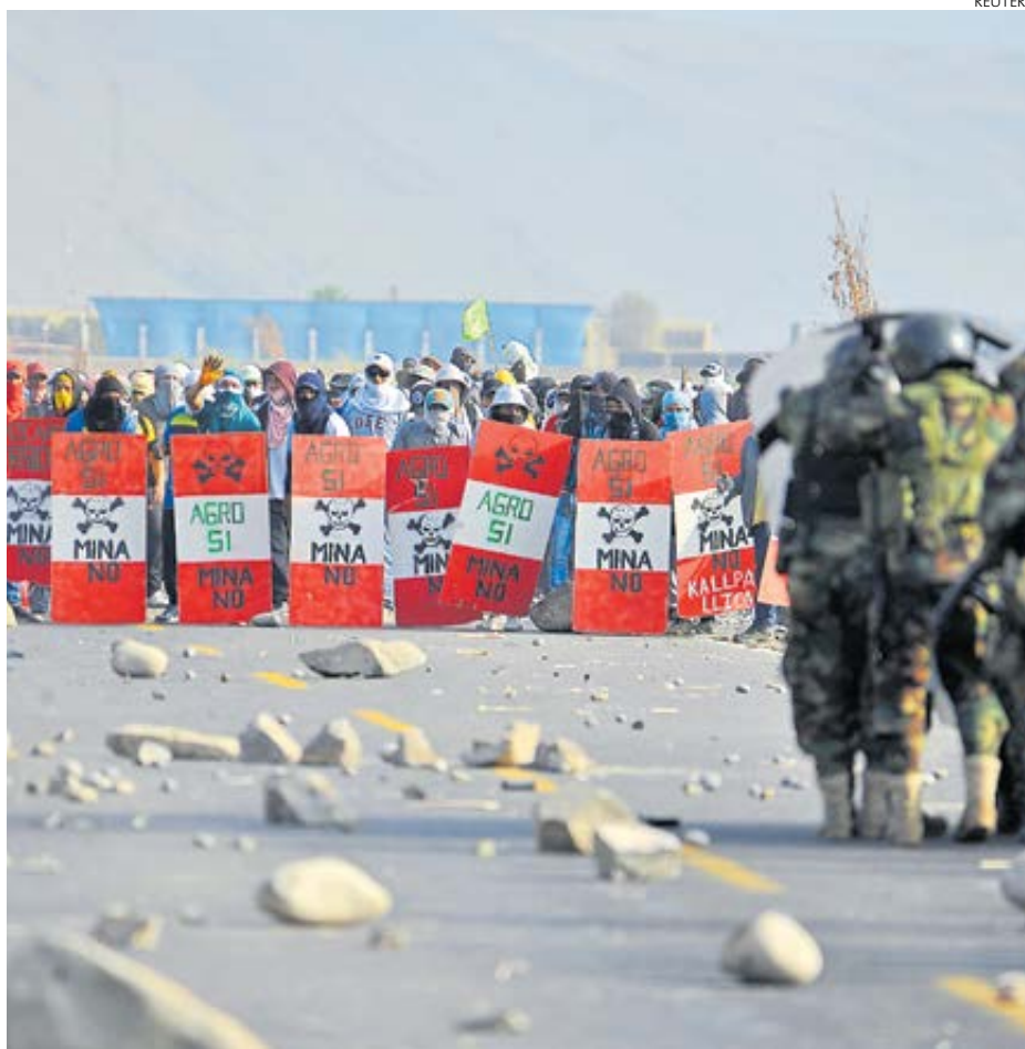
■ ADVERTENCIA. Dirigentes del valle de Tambo han anunciado movilizaciones del 1 al 7 de setiembre.

Según precisa, la situación en Matarani provoca daños