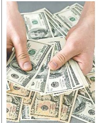
Es usado cada vez menos.

A comienzos del año, la calificadora de riesgo soberano Standard & Poor's destacó como positivo los esfuerzos del Ejecutivo para incentivar la inversión pública.