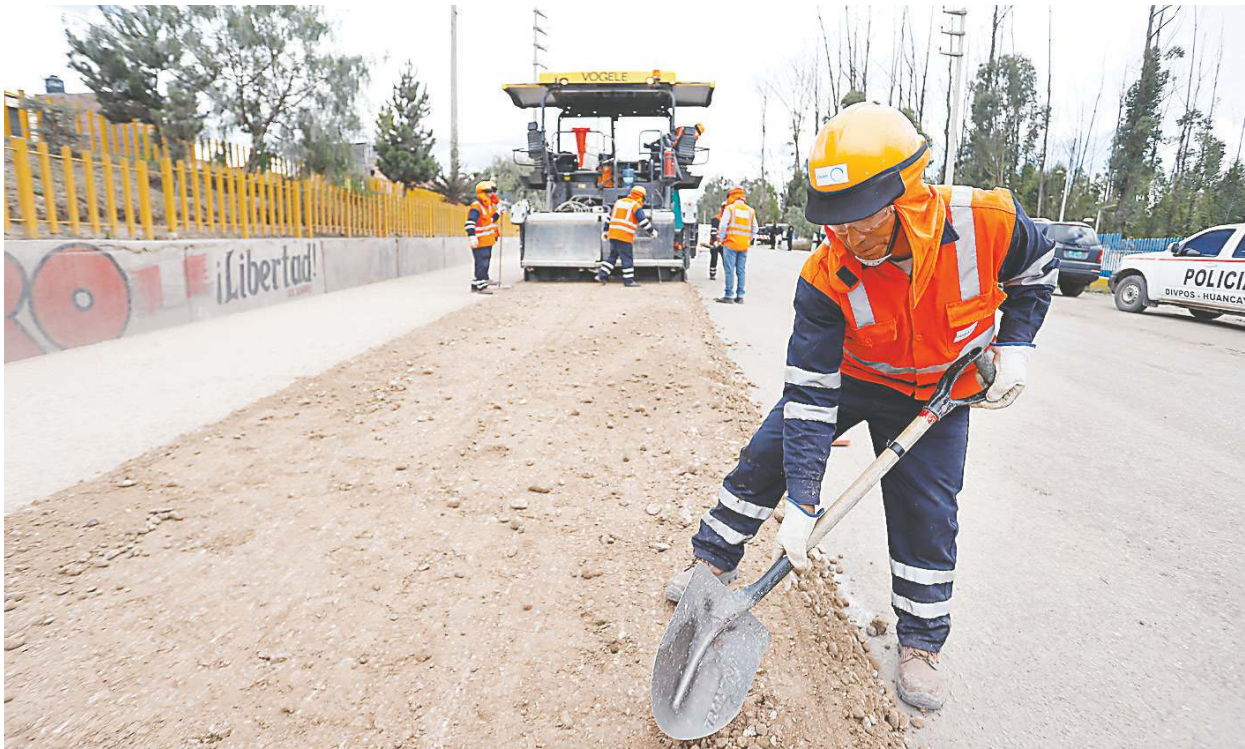
Potencial. El avance registrado en el segundo mes del año fue generalizado, pues se registró en los tres niveles de gobierno.

En ese contexto se establecieron metas mensuales