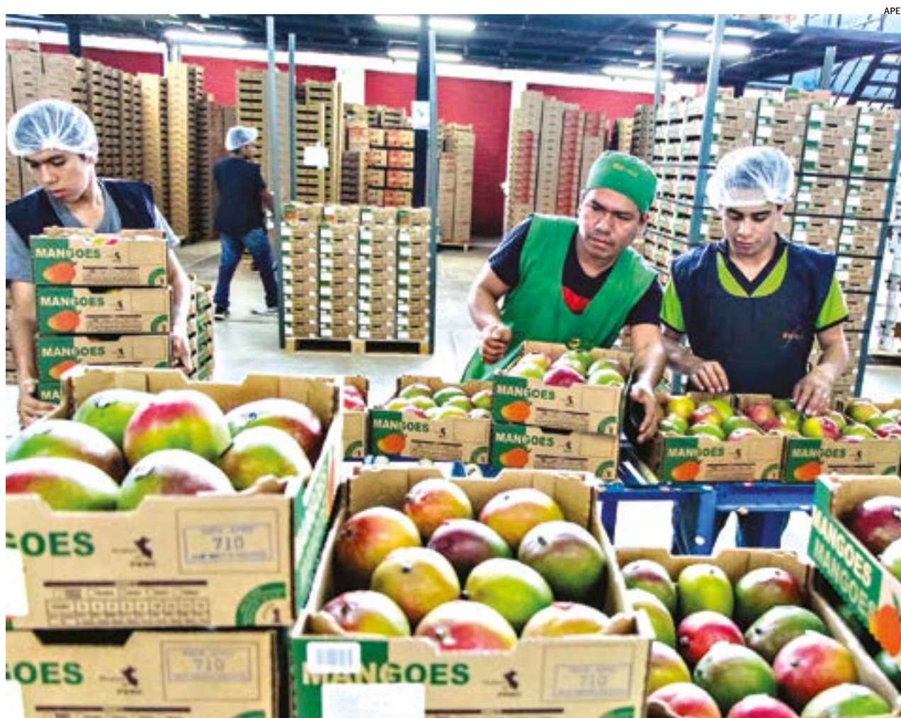
SENSASA INFORMÓ QUE LOS ENVÍOS DE MANGO DE PIURA SUMARON UNAS 2019 MIL TN APROXIMADAMENTE EN LA CAMPAÑA 2019/2020.