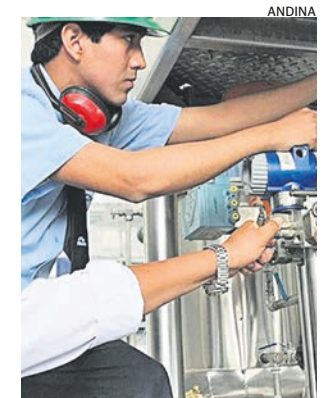
INICIA EN EL MES DE JUNIO.

●● Tras detallar que la economía peruana está operando al 44% durante esta primera fase de reactivación económica, la ministra de Economía y Finanzas (MEF), María Antonieta Alva, precisó que la fase 2 -que empezaría desde este lunes 25 de mayo con la reapertura de nuevas actividades- permitirá que la actividad llegue a operar al 84% hacia fines de junio.