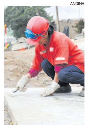
Desde el 1 de mayo el sueldo mínimo aumentará en S/95.