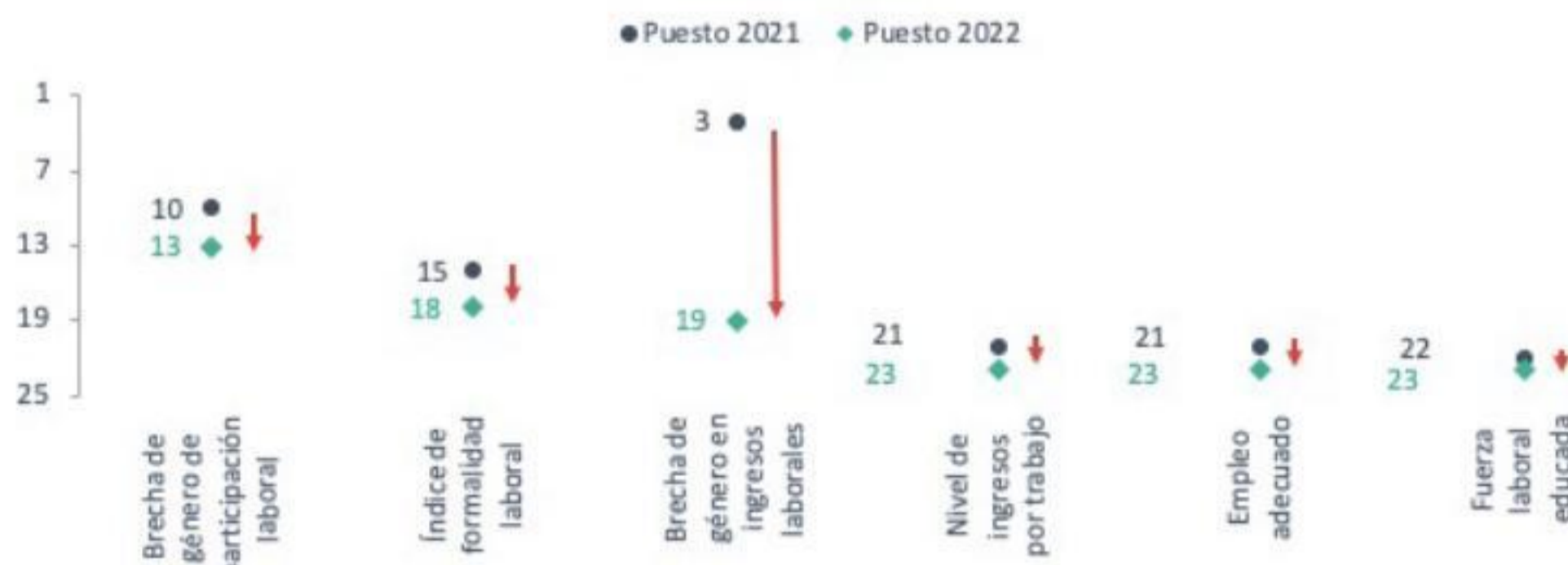
Huánuco: Pilar Laboral - INCORE 2021 vs 2022 (puesto de 25 regiones*)

www.instituto-peruano-de-economia.gob.pe