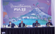
LANZAMIENTO. FIA se desarrollará del 12 al 21 de agosto.

Los organizadores anuncian que la FIA abrirá sus puertas el 12, será hasta 21 de agosto. Los asistentes deberán cumplir con una serie de protocolos sanitarios, como el uso de mascarillas y la presentación del carné de vacunación. El lanzamiento se hizo ayer con la presencia de funciona-