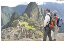
FAVORITO. Temporada aita en Machupicchu desde julio.

La parlamentaria pidió respetar la normativa de protección del patrimonio. “Expreso mi llamado a las autoridades a ejecutar una reactivación turística responsable”, agregó. ♦